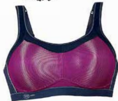
Sport BH Anita Momentum € 64,95