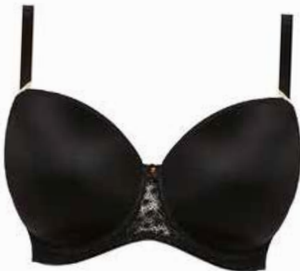
Voorgevormde t-shirt BH Freya Starlight € 59,95