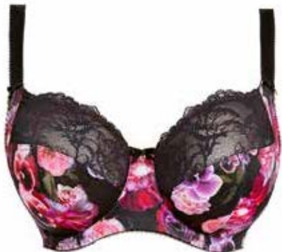
Hele cup BH Fantasie Lilianne € 54,95