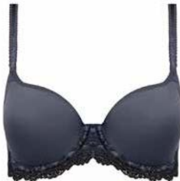
Voorgevormde BH Wacoal Embrace Lace € 60,95